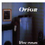
Blue Room - Keltia Musique RSCD 207 – 1993