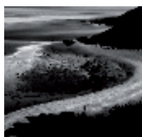
Strawberry Town - Keltia Musique RSCD 295 - 2009