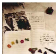
1990- Keltia Musique RSCD 218 - 1990