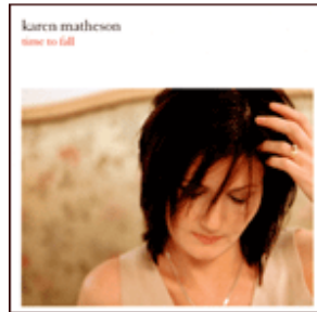
TIME TO FALL – 2002